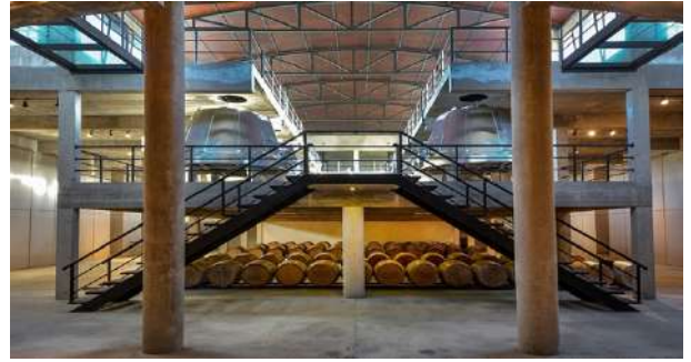
Bodega Voy del Quintón