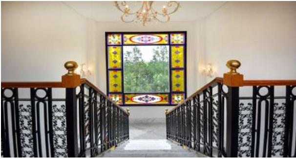
Real de San Carlos