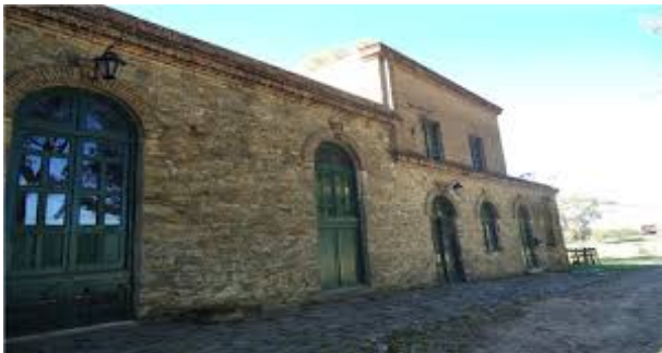
Bodega Cerros de San Juan