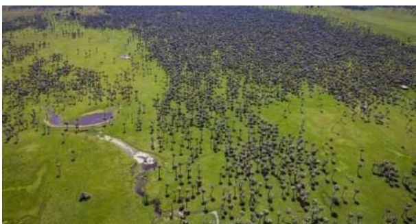
Palmerales de Butiá