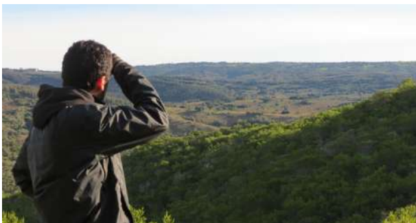
Sierras de Rocha