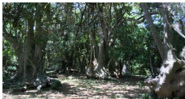
Bosque de Ombúes