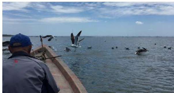
Avistamiento de aves, Laguna de