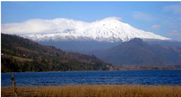
Volcán Shoshuenco, Chile