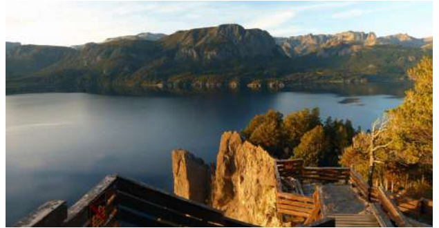
Mirador Lago Traful