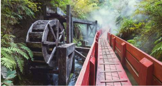
Termas Geométricas, Chile