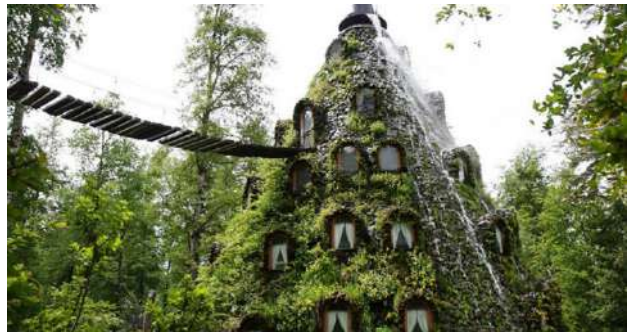
Hotel Montaña Mágica – Reserva HuiloHuilo