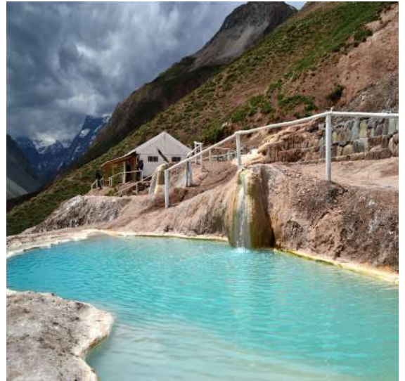
Termas de Baños Colina