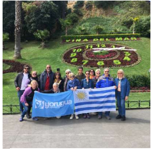
Viña del Mar