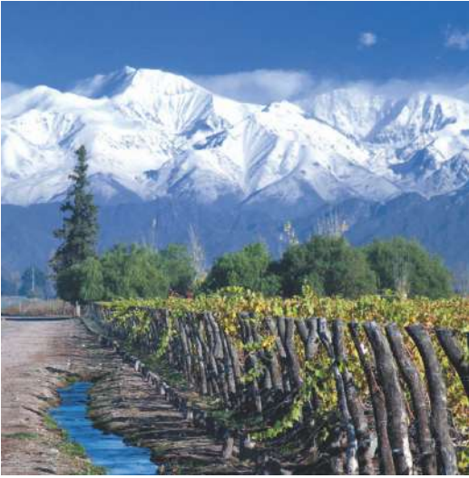
Valle del Uco, Mendoza