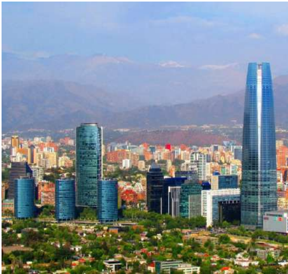
Santiago, Costanera Center